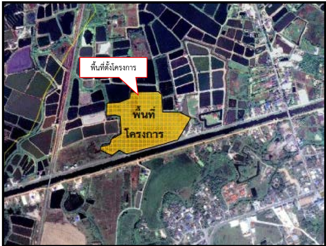
รูปที่ 1.2-1 ที่ตั้งโครงการ ที่มา : การเคหะแห่งชาติ, 2567